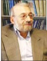
دکتر محمد جواد لاریجانی: مسئولیت قانونی همه خسارات بر عهده موسوی و ستاد اوست